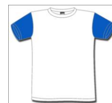
Alunos DRE Lisboa VT