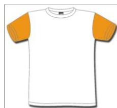
Alunos DRE Centro