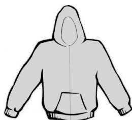
Organização (cor a definir)

A fim de facilitar a todos os intervenientes a identificação dos elementos da organização do evento e dos participantes, informamos que as cores do vestuário se encontram relacionadas com a sua função e que serão distribuídas da seguinte forma: