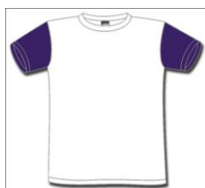
Alunos DRE Norte