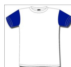
Alunos DRE Açores