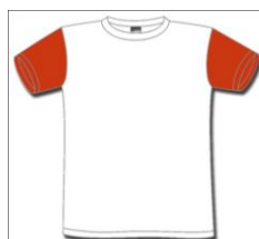
Alunos DRE Algarve