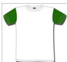
Alunos DRE Alentejo